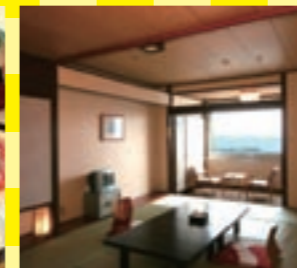
窓の外に広がる大海原。運かに続く海を眺めながらゆっくり過ごせます