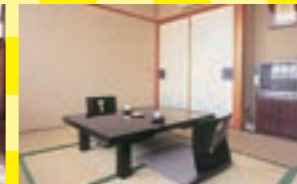
お部屋はトイレ付きの和室。大きくないですが、2人なら充分ですね