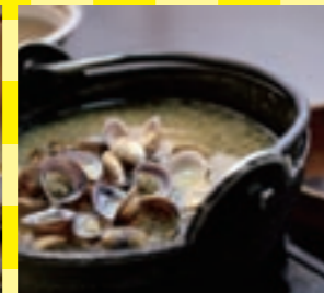
食事も充実。夕食は和会席膳、朝食には人気の鉄鍋味噌汁が登場します