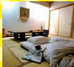
天然温泉とたっぷりの睡眠で、体もお肌もリフレッシュできるはず