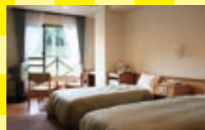
お得なプランは洋風ツインルーム。 窓の外には高原の緑が広がります

日帰り温泉施設を併設しているホ テルです。客室も全てバス付きですが、 この日帰り施設のお風呂や敷地内に あるホテルおかだの大浴場と、様々 なお風呂で温泉を堪能できます。 お得な基本プランでも、もちろん全 てのお風呂を利用できます。食事は食 事処「山彦」で。夕食は新鮮な魚介など 盛りだくさん。朝食は和食のセミバイ キングを味わえます。