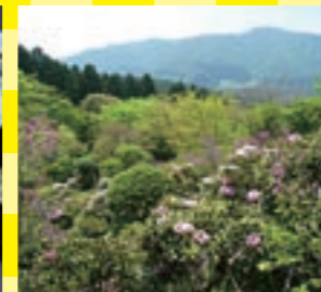
庭園や散策路もあり、野鳥や季節の花など楽しみながら歩けます