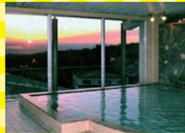
地上から空まで続くグラデーションが美しい景観がお風呂から見られます