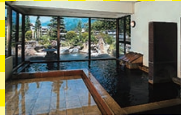
塩原最大級の露天風呂を持つ「幸運の湯」。美肌湯もじっくり楽しめます

メタケイ酸を豊富に含んだ天然温泉が自慢の温泉宿です。保湿成分であるメタケイ酸が基準含有量の6倍も含まれているため、お肌をしっとりとしてよく温めてくれます。 平日限定のお得なプランは8畳の和室で大人2名までですが、大浴場や無料の貸切風呂も利用でき、夕食には名物の「石焼き樽」など全11品の会席膳が味わえます。