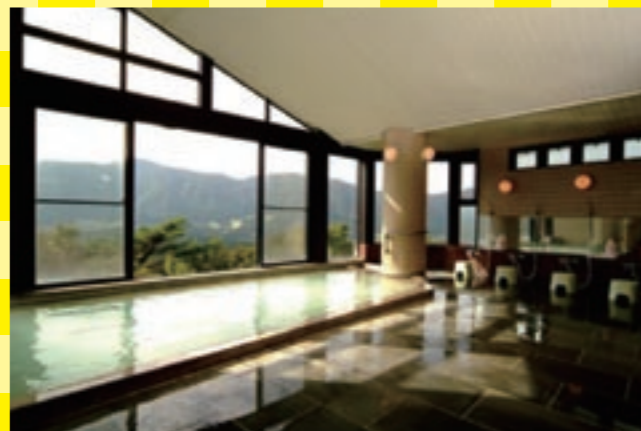
広々とした大浴場からは、富士山や外輪山なども見ることができます

その名のとおり全客室から富士山を眺めることができます。次々表情を変える姿は、ずっと見ても飽きることはありません。大浴場からも箱根ならではの景色を満喫できますよ。温泉は大涌谷が源泉。神経痛などに良いといっしょに湯が体をほぐしてくれます。1泊2食のプランで一番安いのは8,300円。これからは4月の中旬以降から利用できます。