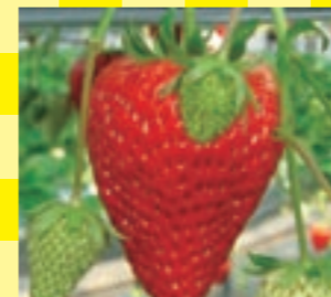
4種類が植えられた提携農園のハウスで30分のイチゴ狩りができます