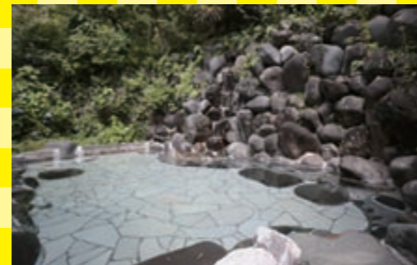
敷地内に2ヶ所の源泉を持ち、露天風呂や富士山が眺められる富士見風呂などがあります。

創業は明治43年という老舗で、川端康成や北原白秋など文豪達も愛した温泉宿です。8000坪の緑豊かな敷地の中に客室はわずか33室。肌あたりやわらかな温泉を堪能できます。 9,800円以下で泊まれるプランはなんと4種類。朝食はシンプルにトーストですが、夕食はお部屋での寿司膳のほか宿の近くにある料理店での食事とプランごとに違ってきます。