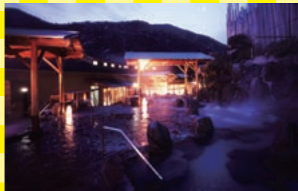
隣接する日帰り施設「湯の里おかだ」。野天風呂など数種類が楽しめます