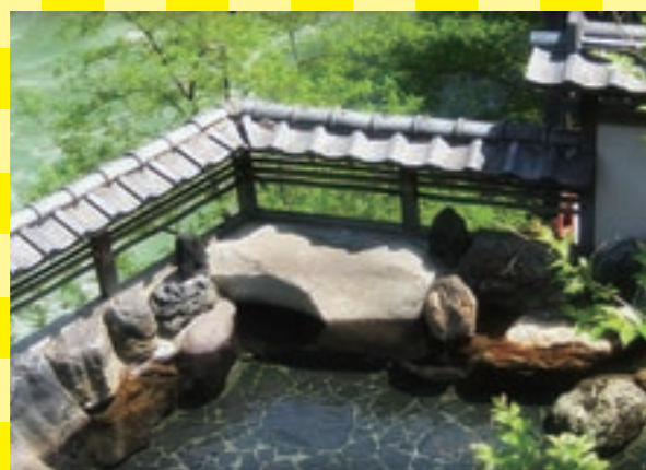
川のせせらぎを聞きつつ緑の木々を眺めながら温泉を存分に楽しめます

神経痛や胃腸病に良いという水上温泉。この天然温泉をゆっくり楽しめるホテル。溪流風呂や展望露天風呂など川沿いのお風呂が充実。大浴場もレトロな雰囲気を楽しめます。少し先ですが、5月中旬～末の特定日には最大24時間ステイが可能なプランが9,450円! 温泉を楽しみたい、また朝はゆっくり寝たい方にもおすすめです。もちろん2食付き。かなりお得なプランです。