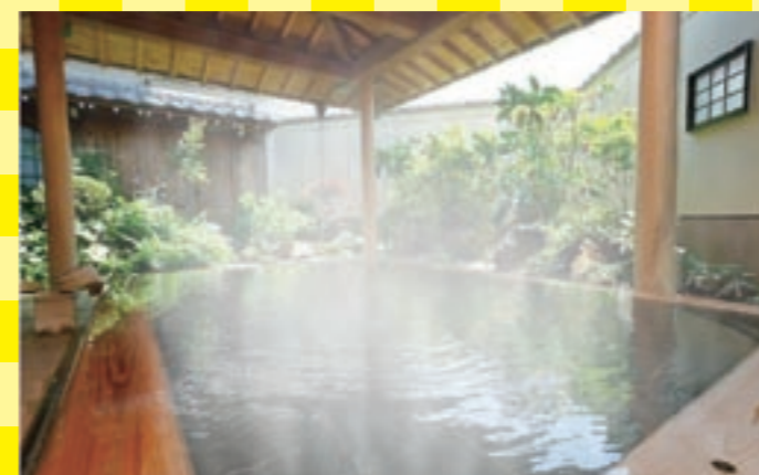
大浴場は種風呂と岩風呂の2種類。男女入れ替えでどちらも楽しめます

房総半島の南端に佇むホテルです。オーシャンビューが楽しめる客室もそろっています。そんな海の眺めが堪能できる和室利用で、お刺身食べ放題が付いた宿泊プランが9,000円から。景観・料理ともに南房総を満喫できます。お風呂はマイナスイオンや美容と健康にも良いという塩泉の天然温泉にじっくり浸かれます。