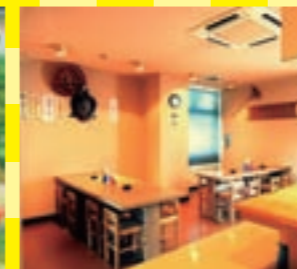
館内には小腹が空いた時におすすめのラーメンコーナーやラウンジも