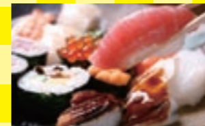
一番安いプランはお部屋で寿司膳。駿河湾で獲れた魚介が味わえます

創業は明治43年という老舗で、川端康成や北原白秋など文豪達も愛した温泉宿です。8000坪の緑豊かな敷地の中に客室はわずか33室。肌あたりやわらかな温泉を堪能できます。 9,800円以下で泊まれるプランはなんと4種類。朝食はシンプルにトーストですが、夕食はお部屋での寿司膳のほか宿の近くにある料理店での食事とプランごとに違ってきます。