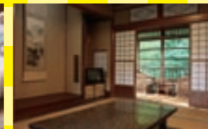
窓の外には迫りくるような大自然の景色。時間を忘れて過ごせそうです