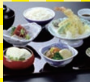
8,300円プランの夕食は旬彩膳などが楽しめます。朝食はビュッフェ形式です