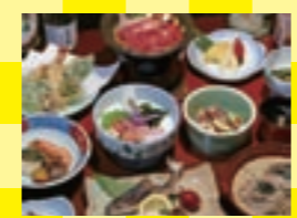
夕食の一例。飛騨牛・川魚などこの地ならではの旬の味覚が満載です