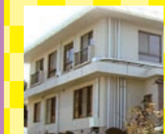
宿の近隣には千鳥ヶ浜海水浴場やスペイン村などレジャースポットも