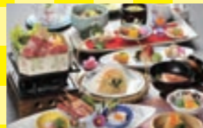
夕食「旬彩会席」の一例。彩も美しく、地元食材を満喫できる会席です

兵庫県 奥城崎シーサイドホテル 「日本の渚百選」や「快水浴場百選」にも選ばれた竹野浜海岸に佇む温泉宿です。海側の客室からは雄大なオーシャンビューが楽しめます。1泊2食付き8,400円のお手頃価格プランは、海側客室も予約可能。但馬牛をはじめ地元食材の夕食も楽しめます。ホテルの近くには夕日の美しいスポットもあるので、散策におすすめです。