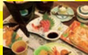
里会席の一例。魚介もたっぷり味わえるボリューム満点の会席料理です

京都府 里のやど川尻 天橋立近くに位置する温泉宿です。疲労回復にもおすすめのアルカリ性単純泉は、西国28番札所である成相寺の麓から湧出する、靈験あらたかな温泉を分けていただいていると言いつつ有り難い湯なのだそう。お得なプランは通年ペットが同伴できるプランです。夕食は里会席。地元海の幸や山の幸をふんだんに盛り込んだものです。帰りには天橋立へ寄るのも忘れず。