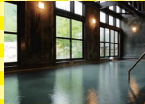
優しい灯りに包まれた落ちつける空間の大浴場。外の景色も楽しめます