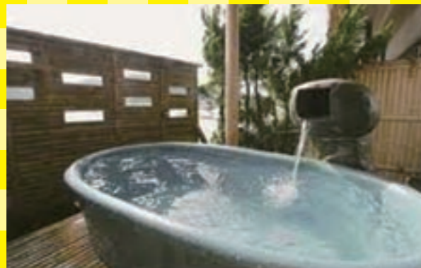
磯の香りを楽しみつつ入れるお風呂。夜は漁火が幻想的な雰囲気を演出します