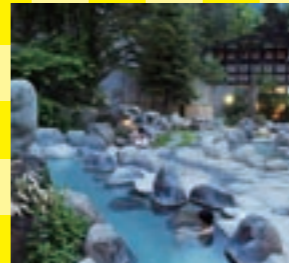
野趣あふれる露天風呂は広さにもビックリ。開放的な気分で浸れます

岐阜県 ひらゆの森 焼岳など活火山を熱源とした温泉が楽しめる森の中の温泉施設です。日帰りでも利用できるお風呂は男女合わせて計16もの露天風呂が揃っています。また大浴場は大きな梁がめぐらされた吹き抜けのレトロな空間。50人は入れるという大きさにも驚きです。湯上がり処もあります。宿泊は1泊2食付きで8,000円〜。プラス1,000円で趣のある合掌棟宿泊も可能です。