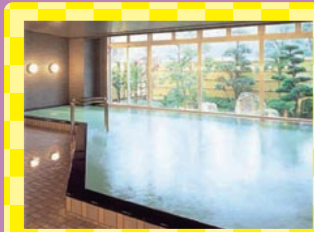
和の景観を眺めつつゆっくり温泉を楽しむお風呂。お肌もツルツルに