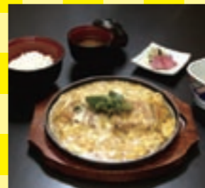
飛騨ぶたの煮カツ定食。生薑焼きもあります。洋食はオムライスなども選べます

岐阜県 高山グリーンホテル ホテルの真下から湧出する飛騨高山温泉が楽しめる宿です。意匠が素晴らしい本陣大浴殿・庭園露天風呂のほかにも、貸切露天や足湯とお風呂の種類も豊富に揃います。7,600円〜のプランは夕食が選べるプラン。飛騨ぶたを使用した定食や飛騨牛カレーライスなど8種類からお好みのメニューを選べます。どれもボリューム満点で大満足です。