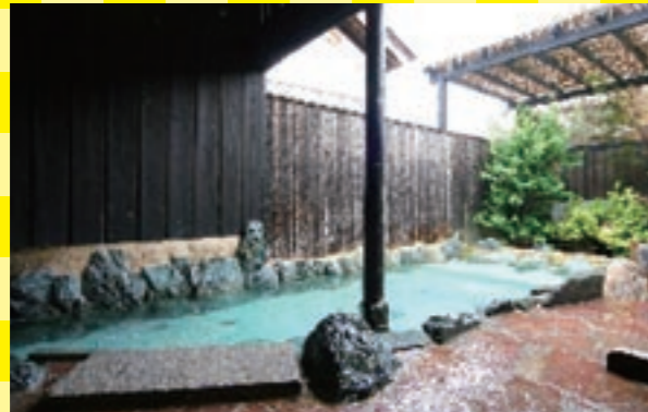
石が配された露天風呂も、新鮮な空気とともに温泉を満喫できます