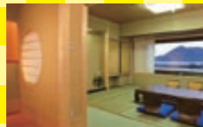
海岸に面した海側客室からは、四季折々の海景色が堪能できます