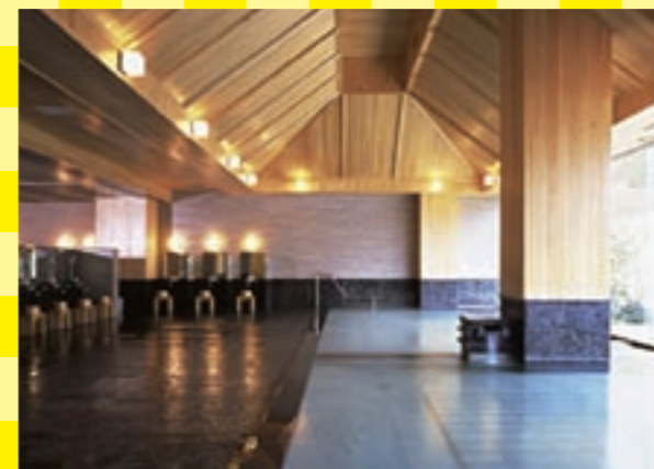
人気の本陣大浴殿。露天風呂は岩を配した野趣あふれる庭園風呂です

〒高山市奥飛騨温泉郷平湯763-1 ☎8,000円～ 日帰り利用:あり ☎中部縦貫道高山I.Cより約40分 http://www.hirayunomori.co.jp/