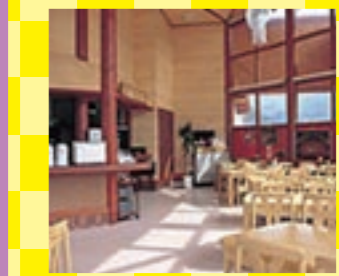
道の駅なので立ち寄りもOK。そばなどもある軽食堂も併設しています