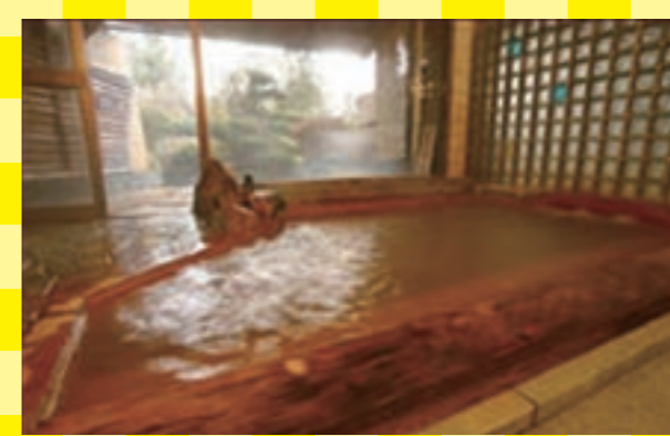
内湯の奥にある露天風呂は、庭園の景観を眺めつつ温泉に浸かれます