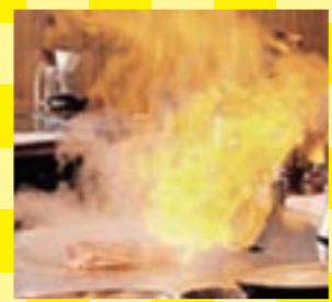
熱い鉄板の上で豪快に焼き上げるステーキ。ジューシーな但馬牛を堪能

道の駅の温泉で日帰り利用はもちろん宿泊もできます。ラドンを含む天然温泉は保温効果に優れているため、芯から体を温めてくれます。また保湿効果もあるので肌にも◎です。 お得なプランでは夕食には但馬牛のステーキが味わえます。併設の和牛レストランにてシエフ自らの目の鉄板で焼き上げるので、香ばしい香りがさらに食欲をそそります。