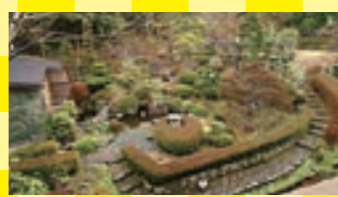
四季折々の景観が楽しめる庭園は、ロビーからも眺めることができます

室町時代に開湯したという湯屋温泉にある宿です。日本では有数のサイダーのような炭酸泉が楽しめます。飲めば胃腸に良いと言われ、温泉に続く廊下には飲泉場も設けています。 ここでは下呂名物の飛騨牛や川魚が楽しめるプランが8,000円。1番安いプランは6畳の部屋と少し小さめの客室ですが、地元グルメと湯屋の炭酸泉は存分に満喫できます。