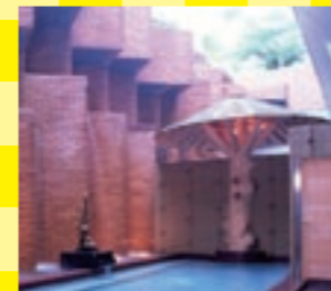
高山祭の屋台彫刻がモチーフの「手長足長の湯」。本殿とは趣が違います