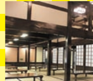
湯上がり処はなんと合掌造り。ジュースなどの販売機もあります