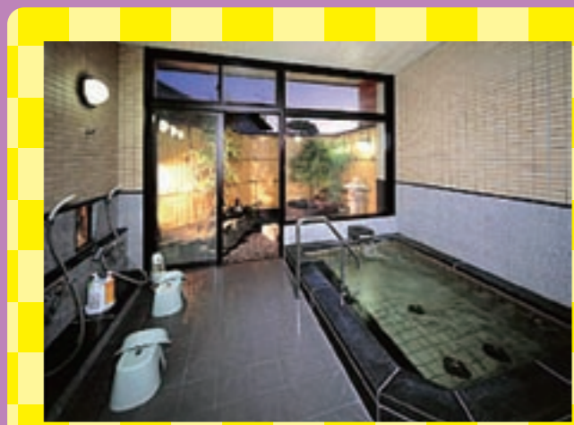
露天風呂付大浴場。情緒豊かな露天のお風呂は信楽の陶器を使用