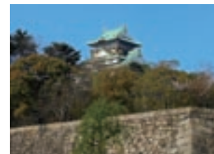
天守閣は博物館になっています。 歴史に興味がある方にもおすすめです

部門は中高生と一般があり、それぞれ5kmと10kmの2種類があります。気軽に参加出来るマラソン大会という事でも人気があるようです。7月のエントリーは終了していますが、8・9月も行われる予定です。