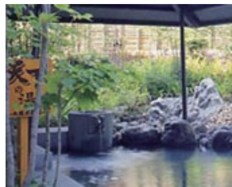
▲近隣の野趣あふれる和風露天風呂「天下の湯」。温泉気分を満喫できます

Date 住 京都市伏見区竹田青池町130 ☎ 075-645-4126 営 10:00～翌2:00 休 不定休※年2回のメンテナンス休業あり 料 大人600円～、小学生300円～、幼児200円～ 交 近鉄・地下鉄竹田駅西2番出口より徒歩3分 http://www.chikara-u.com/