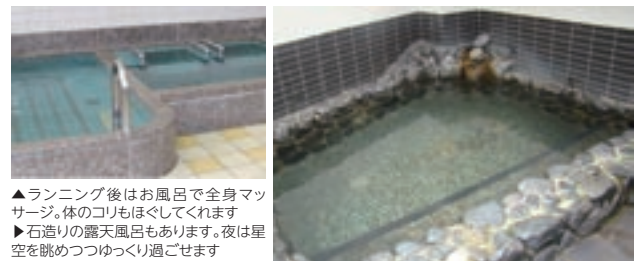
▲ランニング後はお風呂で全身マッサージ。体のコリもほぐしてくれます ▶石造りの露天風呂もあります。夜は星空を眺めつつゆっくり過ごせます

ランニングステーションを実施している銭湯です。入浴料金のみでロッカーに荷物を預け、ランニングを楽しめます。付近には名古屋城などもあるので、ランニングコースとしても最適です。仕事帰りに立ち寄るのにも便利なステーションです。 お風呂は全身マッサージをしてくれる「スーパージェット」や体を癒してくれる「くすり風呂」、露天風呂もあります。またこの2階には「コメダ珈琲店」があります。ランニング後にお風呂でさっぱりしたら、コーヒーを飲みながら休憩するのも良いですね。