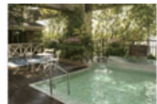
メンズフロアには開放感ある露天風呂も。都市部とは思えない空間です

駅近の都市型スパで男性・女性とフロアが分かれており、趣も全く違います。男性フロアにはリゾートの様なハンガリアンバスや露天風呂、体を癒してくれるジャグジー、女性フロアには蒸気や香りに癒されるローズテラマソムや岩盤浴・エステなども揃います。 ここではメンズフロア、レディースフロア、フィットネスフロアで「ランニングサポートプラン」が用意されています。それぞれのフロアで着替えた後、外でのランニングを楽しみ、戻って来てからお風呂を楽しむプランです。フィットネスフロアにもシャワー、サウナがあります。