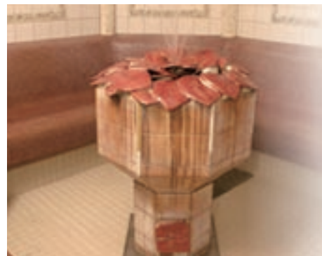
▲ハラのアロマミストが肌を潤し、香りも楽しめるローズテラマソム

Date 住 和歌山市毛見1525 和歌山マリーナシティ内 ☎ 073-448-1126 営 10:00～24:00 休 なし 料 大人800円～、小人500円～ 交 阪和道海南ICより約10分 http://www.marinacity.com/spa/