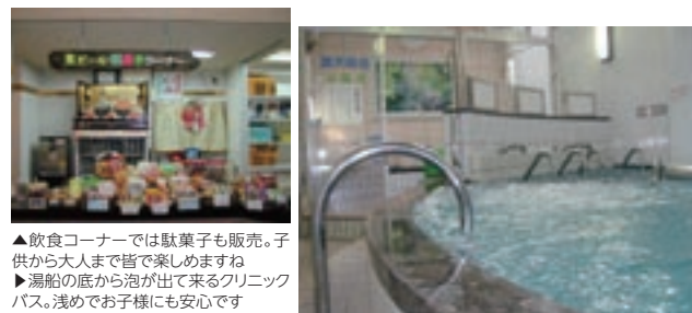
▲飲食コーナーでは駄菓子も販売。子供から大人まで皆で楽しめますね ▶湯船の底から泡が出て来るクリニックバス。浅めでお子様にも安心です

長居公園近くにある銭湯で、ランニングステーションとして利用出来ます。ここで着替えた外周約2.8kmという長居公園を自由にランニング。その後お風呂でさっぱりというコースがなんと通常料金でOKです。 浴場は毎月男女入れ替え。ランニング後の体をマッサージしてくれるクリニックバスや露天風呂もあります。入浴後は飲食コーナーでビールやソフトアイスも楽しめます。昔懐かしい駄菓子も販売しているので、これをつまみに1杯もいいですね。