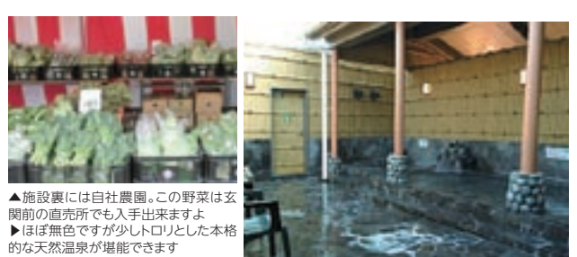
▲施設裏には自社農園。この野菜は玄関前の直売所でも入手出来ますよ ▶ほぼ無色ですが少しトロリとした本格的な天然温泉が堪能できます

毎日タンクローリーで「能勢アトレイク温泉」より運んでくる天然温泉が開放感のある露天風呂で楽しめます。ほかに毎日入浴剤が変わる「日替わり湯」など様々なお風呂やサウナが揃います。また併設の旬菜庵では、自社農園で作られた野菜も味わえます。 現在はランナーズステーションとしても利用できます。受付後自由なコースでランニングをし、戻ったらお風呂でさっぱり出来ます。利用料金は入浴料込みで800円。お風呂の後に自慢の野菜料理を味わえば、さらに健康的な過ごし方が出来ますね。