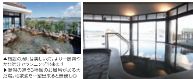
▲施設の周りは美しい海。より一層爽やかな気分でランニング出来ます ▶湯温の違う3種類のお風呂がある大浴場。和歌浦を一望出来ると景観も◎

Date 住 名古屋市西区上名古屋1-12-5 ☎ 052-521-4126 営 平日土祝14:00～24:00 日9:00～24:00 休 月※祝日の場合は翌日 料 大人400円、中人150円、幼児70円 交 地下鉄名城線 名城公園駅より徒歩約13分 http://www.yachiyoyu.com/