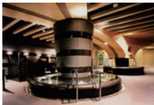
男性用の泡風呂や垢すり台には高級感ある天然御影石を使用しています