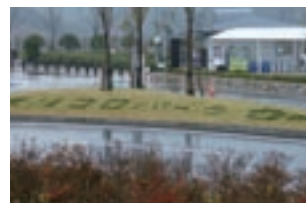
香流川緑地からモリコロパークまで景色を楽しみながら走れます

神経痛などに良い天然温泉が堪能出来る施設です。浴場は1Fにある和風の「地の湯」と2Fの洋風「天の湯」と趣の異なるお風呂があります。週ごとに男女が入れ替わるのでどちらのお風呂も楽しめます。それぞれ開放感ある露天風呂もあります。ここでは7月8日(日)にランニングと温泉を楽しむイベントがあります。自然の中を走るだけでなく、ウォームアップやフォームなどまで指導してもらえますので、走り方を学びたい初心者にもお勧めです。このようなランニングイベントは随時行われています。