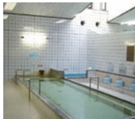
賑やかな会話が聞こえてきそうな庶民的な雰囲気の銭湯です

大阪城に程近い住宅街の中にある天然温泉の銭湯です。ノスタルジックな雰囲気を出す浴場には、源泉を堪能出来るお風呂もあります。ナイトランの後におすすめです。