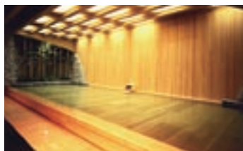
男性用天然古代檜風呂。 シンプルで上品なお風呂でリラックス出来ます

またボディーケアやエステなどリラクゼーションメニューも充実しています。お風呂と共におすすめです。