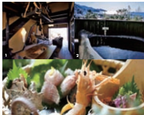
1 囲炉裏も全ての客室にあります。より一層温かみを感じさせてくれます 2 巨石をくり抜いた露天風呂がウズラの卵に似ているという客室「鶏」 3 山海の幸が豊富な土肥ならではの旬の味覚を美しく仕立てた創作料理

土肥の名産「枇杷」をその名にしたという温泉宿です。駿河湾を臨む山の中腹に佇み、客室は8つの離れのみという宿。平屋建てのタイプと二階建てのタイプがあります。全てモダン古民家様なスタイルで、囲炉裏のある和洋室。ベッドが2台設置されています。枇杷の木のある部屋では、実がなる頃は自由にもいで食べても良いそうです。また露天風呂も全ての客室に備えてあります。ほかに2つの貸切露天風呂もあります。が、どのお風呂も海の景色を楽しみながら塩化物泉の天然温泉を堪能できます。体がよく温まる湯で皮膚病などにも良いといわれていますよ。 食事もお海を望める個室で旬の創作会席が味わえます。地元野菜や海の幸を使用した料理を、掘りごたつで寛ぎながら堪能できるのがうれしいですね。 さらに滞在中に一度は行きたいのが遊歩道。歩いて約10分の山の展望地までは全て宿の敷地内なので自由に散策できるうえ、自生する枇杷やみかんなどの果実や、山菜だけのこなども自由に採る事が出来ます。頂上から眺める駿河湾の景色もまた絶景です。ぜひ頂上まで登ってみてはいかがでしょう。