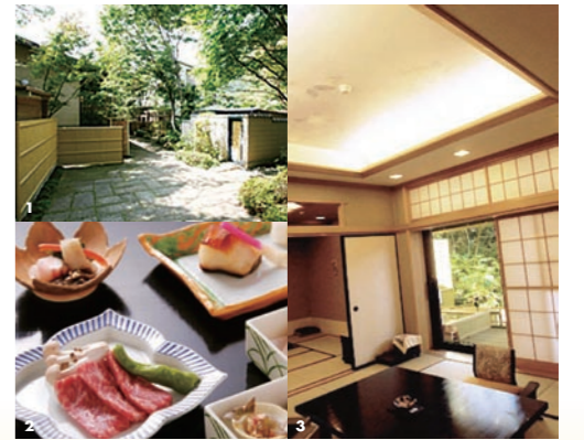
1 敷地内のはじに位置するため、駐車場からすぐプライベートゲートへ 2 ゆっくりと味わえるよう食事は最終スタートが19時〜になっています 3 檜造りの露天風呂付き客室。遠慮することなく、ゆつくりと温泉を堪能

温泉地として人気の高い鬼怒川温泉。この中心地近くにあるのが「鬼怒川パークホテルズ」です。複数の宿泊施設を持つホテルの中で特におすすめなのが「木心亭」です。中学生以下のお子さんはお断りのため、静かに過ごしたいご夫婦やカップルにおすすめです。お部屋は全て純和風。次の間付きや露天風呂付きなどゆつたりした部屋タイプが特徴。敷地内に大浴場もありますが、自分のペースでゆつくりと温泉を楽しめます。お湯は自家源泉の弱単純アルカリ泉。神経痛などに良い優しい湯が体を癒してくれます。 食事もお部屋で頂けます。木心亭で味わえるのは創作懐石料理「木心膳」。食前酒からデザートまで彩りも鮮やかな料理など13〜15品とボリュームも満点です。静かにそしてゆつくりと味わえるのがうれしいですね。 さらに木心亭には「プライベートゲート」もあります。希望者は予約専用駐車場からゲートを入り、「待合い処」から専用電話をかければ、迎えに来て貰えます。 同じ敷地内の本館「木楽館」には売店やギャラリー、インターネットデスクなども揃っているため、散歩がてら訪れてみるのもおすすめです。