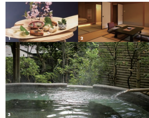
1 食材だけでなく季節感を演出した芸術作品とも言える料理が登場 2 和室とベッドルームがある本館の和洋室の客室。アメニティも充実です 3 湯河原の大自然と美味しい空気とともに温泉を楽しめる婦人用露天風呂

Data 住 足柄下郡湯河原町湯上776 ☎ 0465-63-3333 料 30,000円～ 日帰り入浴 プランあり 交 JR湯河原駅よりタクシーで約7分 HP http://www.tubaki.net/