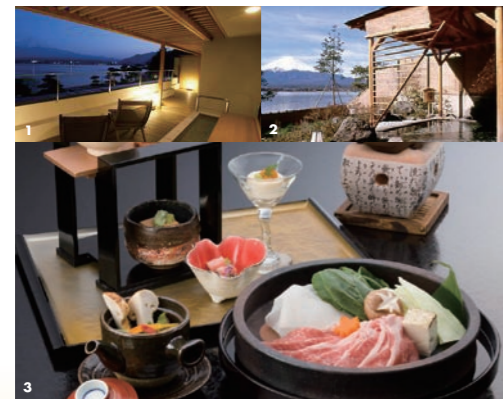
1 足だけ湯に浸かりながら、少し絶景にみとれてものぼせないかも 2 婦人用露天風呂「赤富士」。迫力ある富士山と美しい河口湖がすぐそこに 3 夕食は旬食材を満載した会席料理。2〜4名までは部屋で頂けます

Data 住 南都留郡富士河口湖町河口2312 ☎ 0555-76-8888 料 19,950円～ 日帰り入浴 なし 交 富士急行線河口湖駅より送迎バスあり HP http://www.kogetu.com/