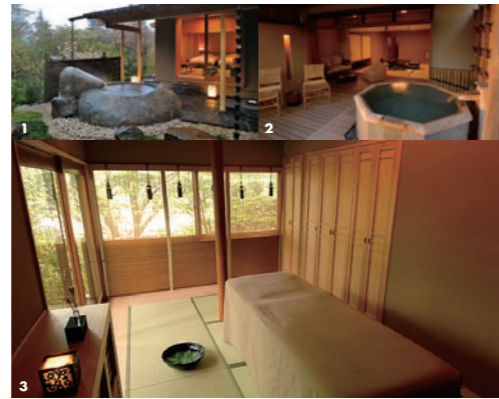
1 離れ貴賓室「花香」は庭園付き。巨石の一枚岩で作られた露天風呂も 2 ウッドテラスに石の露天風呂が付いた「すずかけ」。サウナもあります 3 和モダンで気品のある施術室で心身ともに癒される「KADAN SPA」

富士箱根伊豆国立公園に位置する強羅温泉。明治・大正期には文豪や財界人からも愛され別荘地として栄えたこの温泉地の森の中に佇む閑静な宿です。創業者が宮家より委ねられた土地で戦後開業し平成元年には全面改装、その後平成3年には世界的に有名なホテルレストラングループである「ル・エ・シャトー」の厳選な審査を通過して加盟店に。以後海外からの賓客などからも高い評価を得る旅館となりました。 広大な土地の中に客室は37室のみ。そのうち9室は露天風呂付です。プライベートな空間で温泉を満喫したい方におすすめです。お風呂は露天風呂付の大浴場もあります。3本の自家源泉を所有する温泉は肌にやさしい弱アルカリ性単純温泉です。 また同じ敷地内の「懐石料理 花壇」では、食事と大浴場の入浴がセットになったプランなどもあります。昭和初期に建てられた宮家別邸の洋館の中で食事を楽しましむ事が出来るうえ、温泉も満喫できるのがうれしいですね。 ほかに「KADAN SPA」も併設。玄武岩のパウーストーンならではの遠赤外線効果で体を芯から温めてくれるストーンセラピーボディ「石の温」などのメニューもあります。