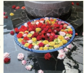
季節によって様々なバラが浮かぶ女性露天の「バラ風呂」。その香りにうっとり

Data 住 笛吹市御坂町成田2200 ☎ 055-261-6166 営 10:00～22:00(最終受付21:30) 休 第2・第4火※祝日の場合は翌日、その他メンテナンス休館あり 料 大人700円、小学生400円 ※時間帯や市内在住者は別料金設定あり 交 中央道一宮御坂ICより約10分 HP http://www.fuefukinoyu.com/misaka/index.html