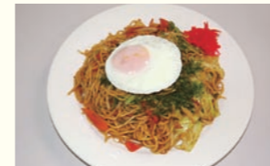
コシのある麺が特徴。独特の辛みと旨みがクセになる「坦々やきそば」

鎌倉時代には湯河原温泉が「こそめの湯」と呼ばれてことからこの名が付いたと言われる日帰り温泉施設です。その意味は「奥地にひそまっている温泉」や「子産め」など、諸説あります。