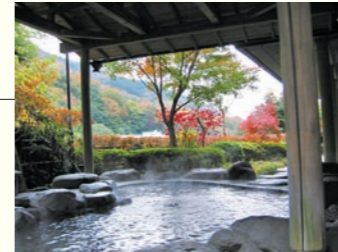
四季折々の景色と新鮮な空気、やさしい天然温泉に癒される露天風呂

Data 住 足柄下郡湯河原町宮上562-6 ☎ 0465-63-6944 営 9:00～21:00(最終入場20:30) 休 月※祝日の場合は翌日 料 大人1,000円、小中学生500円 交 JR湯河原駅より車で約8分 HP http://kogomenoyu.com/