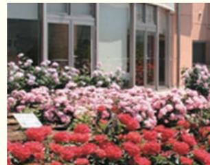
ローズガーデンでは、大自然をバックに鮮やかなバラが咲き誇ります

町の特産であるバラが咲き誇るローズガーデンを併設した日帰り温泉施設です。70種1300株のバラは例年4月下旬～11月中旬頃まで楽しめるので、ぜひ散策したいですね。また地元生産者の協力により毎週月曜日の女性露天風呂では「バラ風呂」が楽しめます。温泉とともに季節のバラを楽しむ、至福の時間を過ごせます。