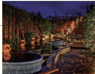
イベント風呂のある露天エリア。開放感のある中でくつろげます

Data 住 海老名市門沢橋2-26-1 ☎ 046-239-1126 営 10:00～24:00(最終受付23:30) 休 なし※メンテナンス休館あり 料 大人800円～、小人400円 交 JR相模線門沢橋駅より徒歩7分 HP http://www.miyako-yu.com/