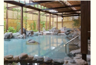
大小の石を配した庭園風露天風呂の「いずみの湯」で湯河原の湯を満喫

Data 住 熱海市泉107 ☎ 0465-63-3721 料 12,750円～ 日帰り入浴 あり 交 JR湯河原駅よりタクシーで約5分 無料シャトルバス運行あり HP http://www.welcity-yugawara.co.jp/