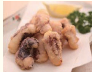
一品ものも充実している「都庵」。お風呂上がりの一杯のお供におすすめ

静岡県 青山やまと Data 住 伊東市岡203 ☎ 0557-37-3108 料 24,150円～ 日帰り利用 プランあり 交 JR伊東駅より無料送迎あり HP http://www.seizanyamato.jp/