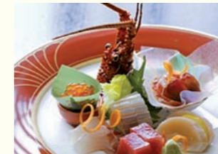
地元の新鮮魚介をたっぷり味わえる料理。ランチ営業もしています

万葉公園からほど近く、静岡と神奈川県の県境に位置する温泉ホテルです。客室は和室・洋室・和洋室などと人数やニーズに合わせた部屋が揃っています。食事は伊豆・相模の新鮮な魚介を中心とした旬の山海の味覚が味わえます。