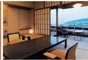
↑ゆったりと清々しさが心地良い「スタンダード客室」。眺めも最高です ←漂う花々に囲まれ、天空で湯に浸かる気分になれる「風の湯」

伊東の高台に位置する温泉宿です。大きく窓が開かれた客室からは、伊豆の山々や海までも望むことができます。部屋タイプは12.5畳と広めのスタンダードタイプから、源泉掛け流し露天風呂付きなどが揃います。