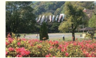
↑泉公園以外でもさまざまな場所でもかわいいつつじの花が咲き誇ります →5000本もの椿が咲く椿ライン。2月上旬頃から花を楽しむ事ができます