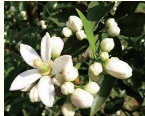
湯河原町に点在するみかん畑の花は5月以降に。果実はもう少し先です