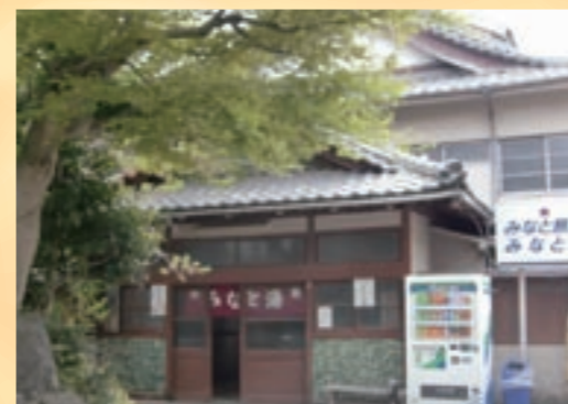
緑の木々とのコラボはもちろん、入口左右のタイルの壁も趣があります。隣が旅館です

住 江戸川区松島4-28-11 ☎ 03-3652-1759 🕒 15:30~23:30 休 8-18-28日※日曜の場合は前日 料 大人450円、中人180円、小人80円 交 JR新小岩駅より徒歩7分 🅇 なし