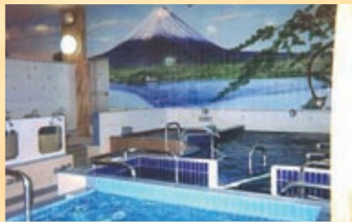
水面に映る逆さ富士まで表現された、力強く迫力のある富士山の絵です

外観だけでなく浴室の背景画も楽しめる銭湯。様々な絵があるなか、象徴的なのは富士山の背景画ですね。