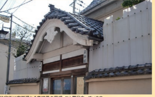
住宅街に突然現れる唐破風の屋根。ひと際目立っています

上が丸い山型で、左右になだらかに広がる裾を持つのが唐破風。鎌倉時代に生まれた日本特有の屋根です。