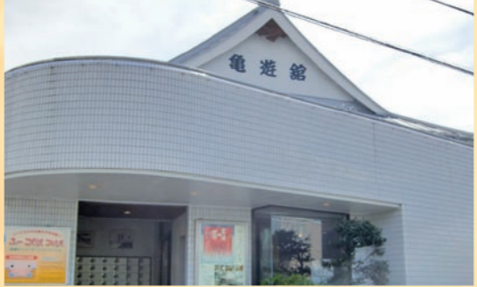
海を思わせるブルーの千鳥破風の屋根が、さわやかさを醸し出します

一般的な宮造りとは違うものや、和洋折衷な外観の銭湯も。こんなレトロモダンな外観の銭湯もあります。