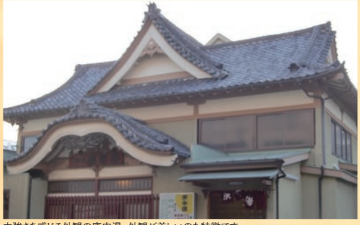
力強さを感じる外観の庚申湯。外観が美しいのも特徴です

唐破風の上に千鳥破風が造られた二段重ねとなっている屋根もあります。特に東京の銭湯では定番だそうです。