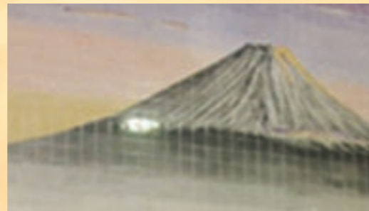
天然温泉の黒湯で体を芯から温めつつ、独特な富士の絵を観賞できます

住 横浜市鶴見区矢向3-28-12 ☎ 045-581-0333 🕒 14:00~24:00 休 月1回不定休 料 大人450円、中人180円、小人80円 交 JR矢向駅より徒歩約5分 🅇 なし