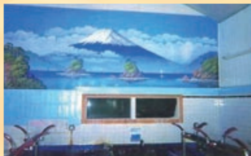
臨場感のある雲をバックにした富士の絵。浴室の水槽も珍しいですね

住 台東区浅草1-11-11 ☎ 03-3841-8645 🕒 13:00~24:00※入浴は23:40まで 休 火※祝日の場合は翌日 料 大人450円、小学生180円、乳幼児80円 交 東京メトロ銀座線田原町駅より徒歩3分 🅇 なし HP http://www.jakotsuyu.co.jp/