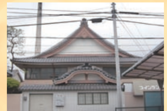
都内でもかなり少なくなった煙突のある銭湯。屋根も見ごたえあります

住 練馬区石神井台6-19-26 ☎ 03-3922-0753 🕒 16:00~23:00 休 月 料 大人450円、中人180円、小人80円 交 西武池袋線 大泉学園駅より徒歩15分 🅇 12台あり