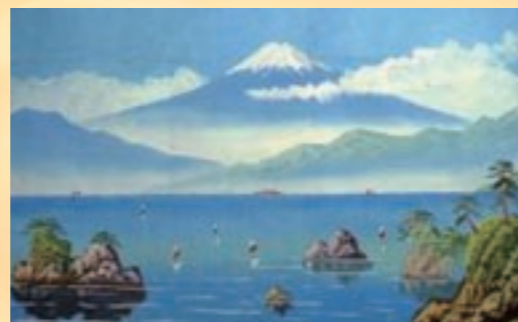
穏やかな海の向こうに雪をかぶった美しい富士。奥行きのある絵です

住 横浜市西区藤棚町2-197-37 ☎ 045-241-2959 🕒 15:00~23:00 休 8-18-28日 料 大人450円、中人180円、小人80円 交 JR横浜駅より横浜市営バス流頭行き乗車・藤棚町二丁目バス停下車徒歩約5分 🅇 なし