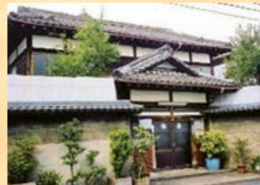
歴史ある建物と木々の緑の融合。この外観も一見の価値がありますね

レトロな建物を樹木や植木などが演出するという、美しいコラボレーションを楽しめる外観の銭湯もあります。