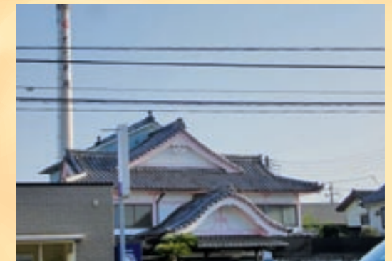
都内の閑静な地にあるたつの湯。なかなか見れない煙突もあります

最近では電気やガスが燃料という所も増えているので消えつつある煙突。かつては銭湯のシンボルでした。