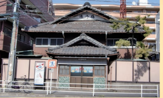
16号沿いに位置し古き良き時代のままで伝統的な姿を今も満喫できる銭湯です

末広がりの美しい三角形をした屋根が千鳥破風です。唐破風同様、銭湯の外観でよく見られる形です。