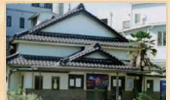
千鳥破風のシンプルな建物。熱田神宮参りの後に立ち寄るのもおすすめ

Data 住 京都市左京区下鴨膳部1 ☎ 075-781-0744 営 15:00～23:00 休 月 料 大人410円、中人150円、小人60円 交 叡山-京阪出町柳駅より車で約5分 P 近隣にコインパーキングあり