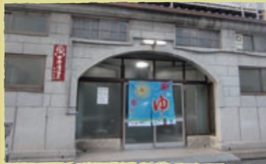
広いアーチ型の入口。シンプルな外観を、カラフルなれんがが彩ります