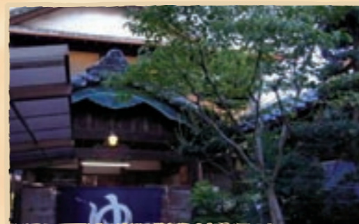
伝統的な宮造りが趣ある銭湯。今では希少となった煙突もあります

外観も楽しめる 銭湯といえばもちろんお風呂ですが、伝統的で美しい外観を持つ銭湯も多くあります。そこで今回は、東海・関西地区にあるレトロで美しい銭湯をご紹介します。