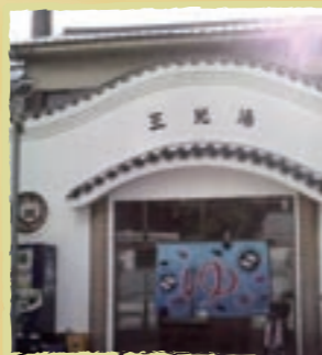
駅からのアクセスも良好。個性的な外観は見の価値がありますね

Data 住 名古屋市中村区道下町4-5 ☎ 052-471-8609 営 15:30～22:30 休 月 料 大人400円、中人150円、小人70円 交 市営地下鉄中村日赤駅より徒歩4分 P なし