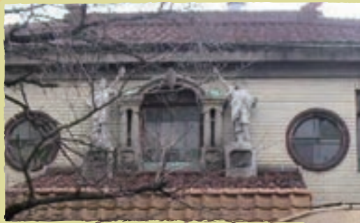
2体の自由の女神が目印。屋根の上にはシャチホコもあります

アーチ状の曲線をデザインに取り入れたものが多い洋風レトロな銭湯。なかには和洋折衷な施設もあります。