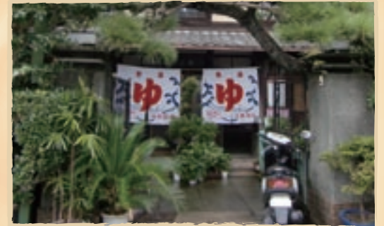
下鴨神社を訪れた後は、ぜひここでひと休みしてはいかがでしょう

唐破風や千鳥破風など、伝統の宮造りの建物や、和の情緒あふれる建物など和風レトロな銭湯があります。