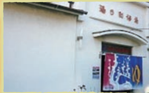
のれんが映える白い建物。「湯の町浴場」の文字もレトロ風でかわいい

Data 住 大阪市生野区林寺1-5-33 ☎ 06-6731-4843 営 15:00～24:30 休 月 料 大人410円、中人130円、小人60円 交 JR寺田町駅より徒歩約15分 P なし