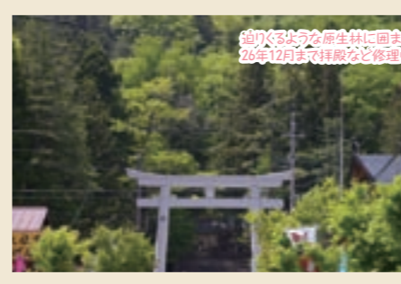
迫りくる大木を原生林に囲まれた本宮。26年12月まで拝観など休館中