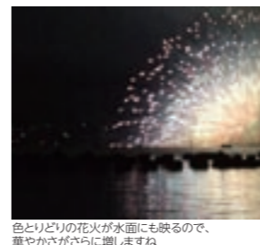
色とりどりの花火が水面にも映るので、華やかさがさらに増しますね

諏訪盆地の中央に位置し、信州一の大きさを誇る諏訪湖。毎年夏から秋にかけて複数の花火大会が行われます。毎年8月15日に行われるのは「諏訪湖祭湖上花火大会」。約40,000発の花火が湖上と夜空を彩ります。毎年9月第一土曜日に行われるのは「全国新作花火競技大会」。選抜の花火師による新たな発想の花火が楽しめるイベントです。 また8月～9月初旬は「サマーナイトファイヤーフェスティバル」と称し、湖畔で毎晩15分間花火が打ち上げられます。いずれも花火を存分に満喫出来るイベントばかりです。