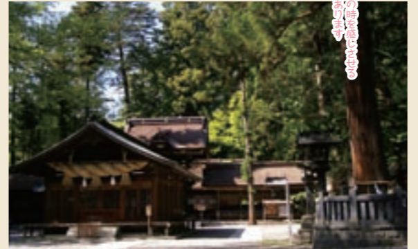
各境内とも悠久の歴史を感じさせる空気をここに感じます

全国に二万以上の御分社がある諏訪神社の総本社で、国内でも古い神社の一つとされています。上社本宮・前宮と、下社秋宮・春宮の二社四宮からなり、前宮以外は本殿という建物が無い「諏訪造り」が特徴で、それぞれ御神木や御山が御神体です。 古くから五穀豊穡や武勇の神として広く信仰され、現代では交通安全や縁結び・合格祈願でも有名です。お祭りでは7年に一度行われる「式年造宮御柱大祭通称御柱祭」も有名ですね。巨木を山より8本切り出し、人力のみで上社下社まで曳いて各お宮の四隅に建てるという迫力あるものです。 ちなみに諏訪大社はパワースポットでも有名ですが、詳細については諸説あります。散策を兼ねて四宮とも参拝し、自分なりのパワースポットを見つけてはいかがでしょうか。 ●諏訪大社ホームページ http://suwataisya.com/