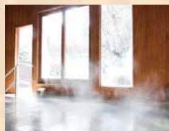
内壁には紀州の杉材、浴槽には石を敷き詰めた自然味がふれる内風呂

休憩所や足湯とともに併設されているのは「めん吉」。当地グルメの和歌山ラーメンやうどんなどがそろっているので、お風呂上がりの食事にぜひおすすめです。