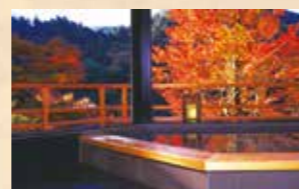
本館にある「展望半露天」では真赤に紅葉した木々を満喫に楽しめます