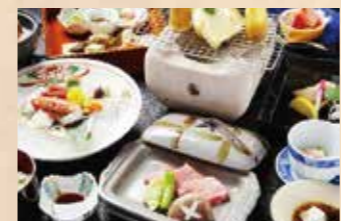
食事は彩り美しい創作和懐石。三河湾の魚介など旬食材をたっぷりと

所在地:新城市能登瀬上谷平4-1 TEL:0536-32-1211 ※はづ予約係 宿泊料金:6,800円~ 日帰り利用:プランあり 交通アクセス:JR飯田線湯谷温泉駅より徒歩約6分 http://www.hazu.co.jp/hazu/