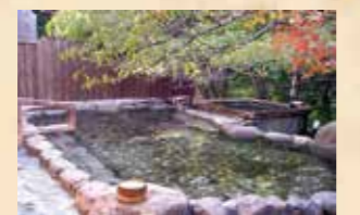
桜ともみじに囲まれた露天風呂。秋は赤く色づいたもみじが楽しめます

所在地:西牟婁郡白浜町古賀浦2763 TEL:0739-42-3010 営業時間:10:00~22:00 休館日:水※祝日の場合は翌日 利用料金:大人500円、小人300円 交通アクセス:JR白浜駅より明光バス三段壁行き乗車、古賀浦バス停下車すぐ http://www.choseinoyu.jp/