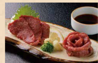
馬刺しや鯉料理などこの地ならではの追加料理(要予約)もそろっています

所在地:佐久市春日2258-1 TEL:0267-52-2111 宿泊料金:9,600円~ 日帰り利用:プランあり 交通アクセス:上信越道佐久I.Cより約30分 http://www.kasuganomori.com/