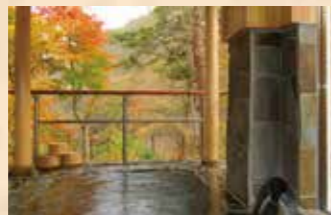
鮮やかに色づいた自然に囲まれて温泉にゆっくりと浸かれる露天風呂