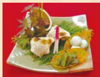
日帰りプランでは旬の食材たっぷりの目にも美味しい料理を、秋も川床で味わえます