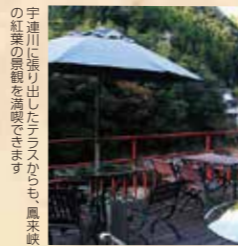
宇連川に張り出したテラスから、鳳来峡の紅葉の景観を満喫できます。