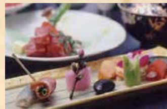
地元の山の幸を中心に、旬食材を美しく仕上げた料理を堪能できます

本館大浴場の「金龍窟の湯」からはまるで絵画のような渓谷の絶景を楽しむ事ができますが、紅葉を存分に楽しむのなら別館の露天風呂がおすすめ。さわやかな空気と紅葉した自然の景観が心を和ませてくれます。宿と同様200年余り湧出している天然温泉は、ほぼ無色という含硫黄ナトリウム・カルシウム塩化物温泉です。また渓谷の美しい自然を眺めながら過ごせる「施設月見台」では、15時~17時の間は抹茶のサービスもあります。