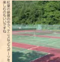
紅葉の景観の中で、テラスからスポーツを楽しむのもいいですね