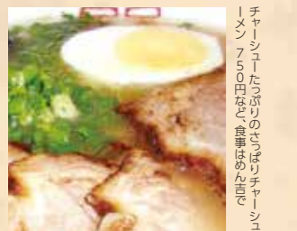
チャーシューたっぷりのさっぱりチャーシューメン、アジの塩焼きなど、食事はめいめい

所在地:西牟婁郡白浜町古賀浦2763 TEL:0739-42-3010 営業時間:10:00~22:00 休館日:水※祝日の場合は翌日 利用料金:大人500円、小人300円 交通アクセス:JR白浜駅より明光バス三段壁行き乗車、古賀浦バス停下車すぐ http://www.choseinoyu.jp/