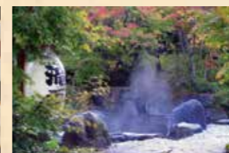
7~8人が入れる大きさの露天風呂。秋の紅葉はもちろん冬は雪景色も楽しめます

食事は、信州蓼科の山の幸など四季折々の旬食材を使用した、彩り美しい郷土料理が味わえます。