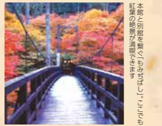
本館と別館を繋ぐ「もみじのつり橋」は、紅葉の絶景が満喫できます

所在地:京都市右京区梅ヶ畑高雄 TEL:075-871-1005 宿泊料金:15,750円~ 日帰り利用:なし 交通アクセス:地下鉄東西線天神川駅・JR花園駅より送迎バスあり ※要事前予約 http://www.momijiya.jp/