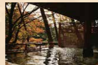
川の音と目の前の紅葉の木、そして温泉が楽しめる「檜の露天風呂」

ナトリウム・カルシウム塩化物泉の湯を堪能できるお風呂は大浴場のほか、渓谷の景観を楽しめる檜の露天風呂、貸切露天風呂があります。また館内ではエステやマッサージを併設しているほか、ヨガ体験や藍染め体験など、休日を有意義に過ごせるプログラムも行われています。