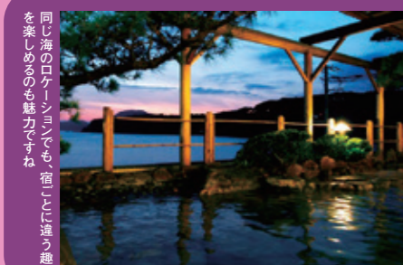
同じ海のロケーションでも「宿」として違う趣を奏する魅力があります。