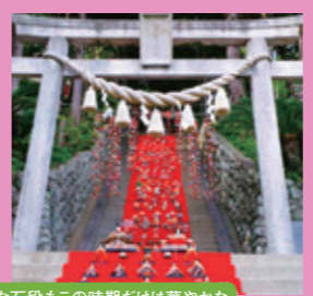
荘厳な石段もこの時期だけは華やかな空間となる、素盞鳴神社の雛段飾り

稲取温泉では現在「雛のつるし飾りまつり」を開催中。各所でつるし飾りの展示やイベントが行われています。見どころの一つはメイン会場の「文化公園雛の館」。稲取のつるし飾りのほか柳川や酒田のものなど、様々なつるし飾りを見ることが出来ます。「海を見守るお雛様」と言われる素盞鳴神社の長い石段を利用した雛段飾りもぜひ見たいものです。また「雛まつり市場」を訪れるのもおすすめ。つるし飾りを購入できます。