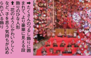
→ たくさんのつるし飾りに囲まれて、お雛様に見える段飾りのひな人形。花のよしがかわいらしく、なご子を思う気持ちが込められている飾り。

稲取のつるし飾りは、明治時代頃にはすでに飾られていたと言われています。子供や孫が健康に育つことを願うが手作りされた人形は、それぞれ異なる意味があるのだそうです。また代々大切に受け継がれている人形も多く、中には100年以上経っているものもあるそうです。