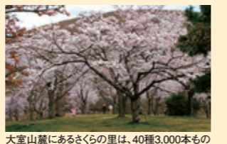
大室山麓にあるさくらの里は、40種3,000本もの桜が植栽されています。