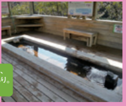
メイン会場の文化公園には、無料で利用できる足湯あり。休憩にぜひ