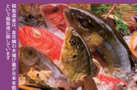
稲取温泉は、金目鯛の水揚げ量が日本有数という稲取港に面しています。