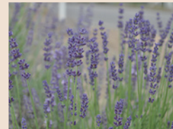
上:屋野山の高台にある広大なラベンダー畑。パノラマの景観も楽しめます 下:祭りではリラックス効果ありというラベンダーの摘み取り体験(有料)も