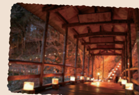
▲冬の「氷灯ろう夢祈願」の時には、より幻想的な雰囲気を楽しめる五台橋