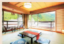
角部屋の和室は、周囲の山々や鹿教湯温泉街を眺めながらより寛げます

HP http://www.saito-hotel.co.jp/ 泉質 弱アルカリ性単純温泉