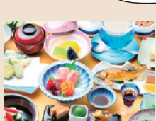
料理はスタンダードのほか、ひかえめ、こだわりのプランなどあります