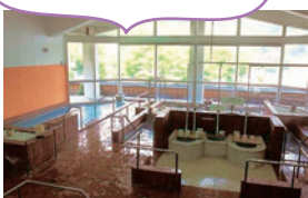
バーテゾーンは泡沫浴や歩行浴、箱蒸しなど8種類の浴槽が楽しめます