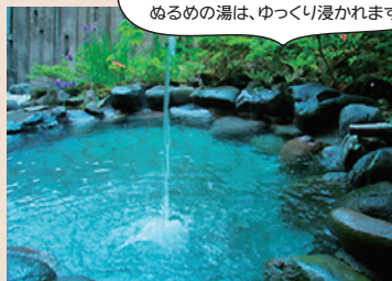
露天風呂は岩の湯船。外気温で少しぬるめの湯は、ゆっくり浸かれます