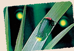
▲ホテルを捕獲したり、フラッシュ撮影はNG。観賞時はマナーを守って

例年、6月中旬～下旬頃の夕刻には、鹿教湯温泉の中心にある湯端通りのホテル水路で、ホテル観賞を楽しめます。ここなら浴衣でちょっと見に行く、なんてことも可能ですね。また同時期に、「狐塚ぼたるの里」への観賞ツアーも開催予定です。 ※ホテルやツアー情報は、事前に確認を