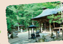
◀天井に描かれた龍が見事という文殊堂。春祭りには多くの人が訪れます

鹿教湯には観光スポットも多数あります。現世と神の世界を結ぶと言われ、屋根のある姿が趣ある「五台橋」。その少し先にあるのが、春祭りでは「知恵の団子まき」で賑わう「文殊堂」。また温泉街から少し離れた所には、鹿教湯を一望できる展望台も。天気の良い時におすすめの場所です。