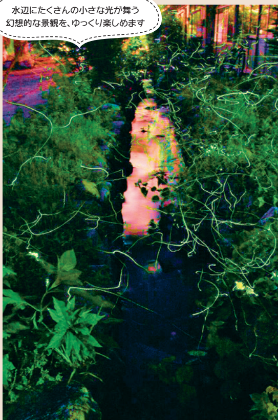
水辺にたくさんの小さな光が舞う 幻想的な景観を、ゆっくり楽しめます