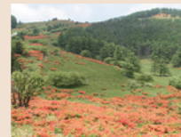
上:桜の名所としても広く知られる、真田氏にゆかりのある「上田城跡公園」 下:6月中旬～7月上旬頃まで、レンゲツツジが楽しめるという「美ヶ原高原」