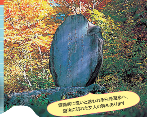
胃腸病に良いと言われる白骨温泉へ、 湯治に訪れた文人の碑もあります