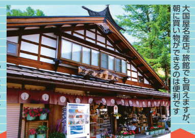
大国屋名産店。旅先でも買えますが、朝に物があるのは便利です。

白骨温泉には7:00~の「大国屋名産店」や8:00~の「白骨齋藤売店」など、早朝から営業する土産店も。せっかくだから地元の店で買いたい物がある、そんな方におすすめです。