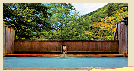
色鮮やかな緑の景色を見ながら、 新鮮な空気と天然温泉を満喫できます

☎0263-93-2917 ●松本市安曇白骨温泉 営業期間:4月25日~11月 営業時間:9:00~17:00 休館日:水 利用料金:700円 http://www.baikooan.net/ 泉質:含硫黄-カルシウム-マグネシウム-ナトリウム-炭酸水素塩温泉