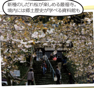
日蓮上人の一代記を描いた90枚の絵のある清雲寺も土肥桜の名所です

土肥周辺では4月までと長い期間、様々な場所で桜の花を楽しむことができます。1月中旬から楽しめる土肥桜は、今回ご紹介したまつり会場以外にも万福寺などでも楽しむことができます。そして4月に入ると「伊豆最福寺しだれ」。その名の通り最福寺で咲くこのしだれ桜は、2001年に新種と認定された珍しいもの。開花中には野点サービスも行われます。同時期には、岐阜県根尾村の二世という小下田里山の薄墨桜も開花。ここでは富士山を背景に、ソメイヨシノも楽しめます。ほかに牡丹桜と、冬から春まで続々と桜を楽しめます。