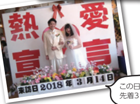
この日オリジナルの恋人証明書は、先着314名だけ。早めに行くのがおすすめ!