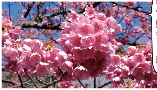
期間 2020年1月19日(日)～2月2日(日)※土肥金山夜桜ライトアップは1月18日(土)～10:00～15:00※土肥金山夜桜ライトアップは18:00～20:30(最終入場20:00) 場所 松原公園芝生広場ほか

土肥桜のルーツは、八木沢小池地区の山林にあった桜。地元医院を訪れ偶然目にした北海道大学名誉教授小川義雄氏(当時)が、珍しいこの桜に惚れ込み、殖やし始めたのが始まりです。そして冬の桜で土肥を訪れる人々を迎えたいと、40年ほど前から苗木を育成。土肥エリアの数十箇所に植栽をすすめてきたそうです。同じ早咲きの河津桜との違いはさらに開花時期が早く、花弁は色が濃いピンクで、付け根の重なり方も違う点。花は濃いピンクと、薄い紅色がかかった白もあるそう。恋人岬や松原公園などで見ることができます。