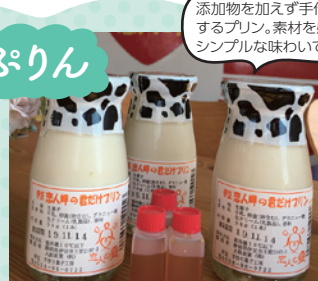
販売店 伊豆手作り菓子工房グリーンヒル土肥 ☎ 0558-98-0722 住 伊豆市土肥2197-2 時 8:30～17:00 休 店舗に確認 HP http://izu-toriyose.shop-pro.jp

伊豆産の卵の黄身と生乳をたっぷり使用したプリンです。「グリーンヒル土肥」のほか、恋人岬のステラハウスでも販売。伊豆のスイーツで、大切な人と甘い時間を過ごしてみてもいい。