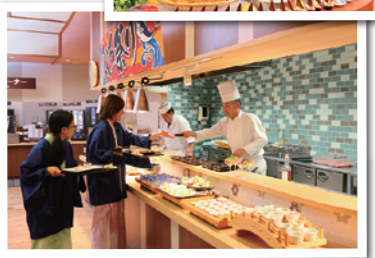
↑海の幸もたっぷり創作バイキング

所在地 伊豆市土肥2791-4 ☎ 0570-091126 料 平日大人3名1室利用お一人様8,980円～(税別) 日帰り利用 あり HP https://toi.ooodoosen.jp/