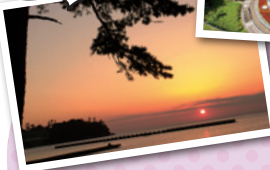
住 伊豆市土肥2657-6 交 土肥温泉バス停よりすぐ