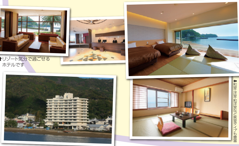
↑リゾート気分でご過ごせるホテルです

お食事は伝説の料理人がプロデュースした創作バイキング。地元素材と駿河湾の海の幸を使用した季節を感じる料理に舌鼓