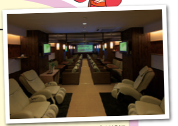
↑バーラウンジは、お昼は湯上り処に