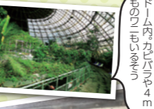
まるでジャングルのようなドーム内。カピバラや4mものマンゴーの木

温泉熱を利用した亜熱帯エリアのジャングルドームなどがあります。高さは何と15m。ゾーンが3階層に分かれたエリアに生息する、さまざまな動物植物を見ることができます。