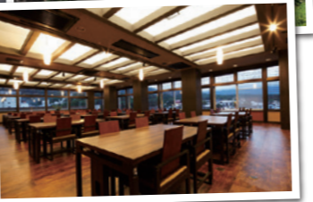
↑最上階メインダイニングでは朝食も