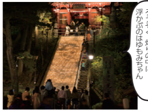
湯畑前の光泉寺境内に広がるキャンドルの灯り。湯畑の湯もあたたかいです。

3月開催日 14日(土)・20日(金祝)・21日(土)・28日(土)※天候により中止の場合あり 開催時間 18:30~21:00 問合せ先 草津温泉旅館協同組合 0279-88-3722