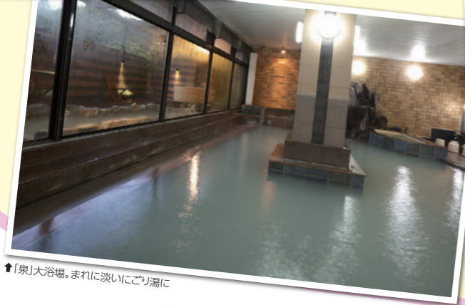
↑「泉」大浴場。まれに淡いにごり湯に