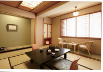
↓純和室のほか客室タイプもさまざま