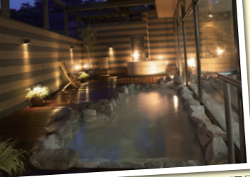
↑岩風呂や樽風呂がある「泉」露天風呂