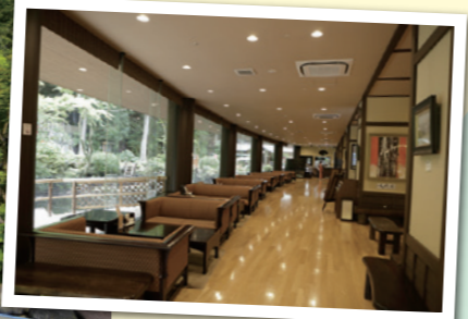
箱根湯本温泉 天成園

所在地 神奈川県足柄下郡箱根町湯本682 問 0460-83-8511 料 1泊2食お一人様¥14,850~ 日帰り利用 2,530円(入湯税50円別) HP https://www.tenseien.co.jp/