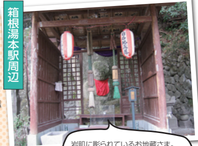
岩別に彫られているお地蔵さま。その昔、近くに石切り場があったそう。

常設・特別展示室のほか図書室、体験コーナーも。いろいろ楽しめます。 住 箱根町湯本266 問 0460-85-7601